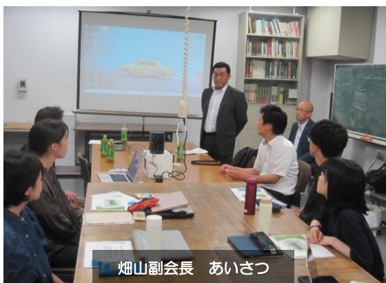
畑山副会長 あいさつ